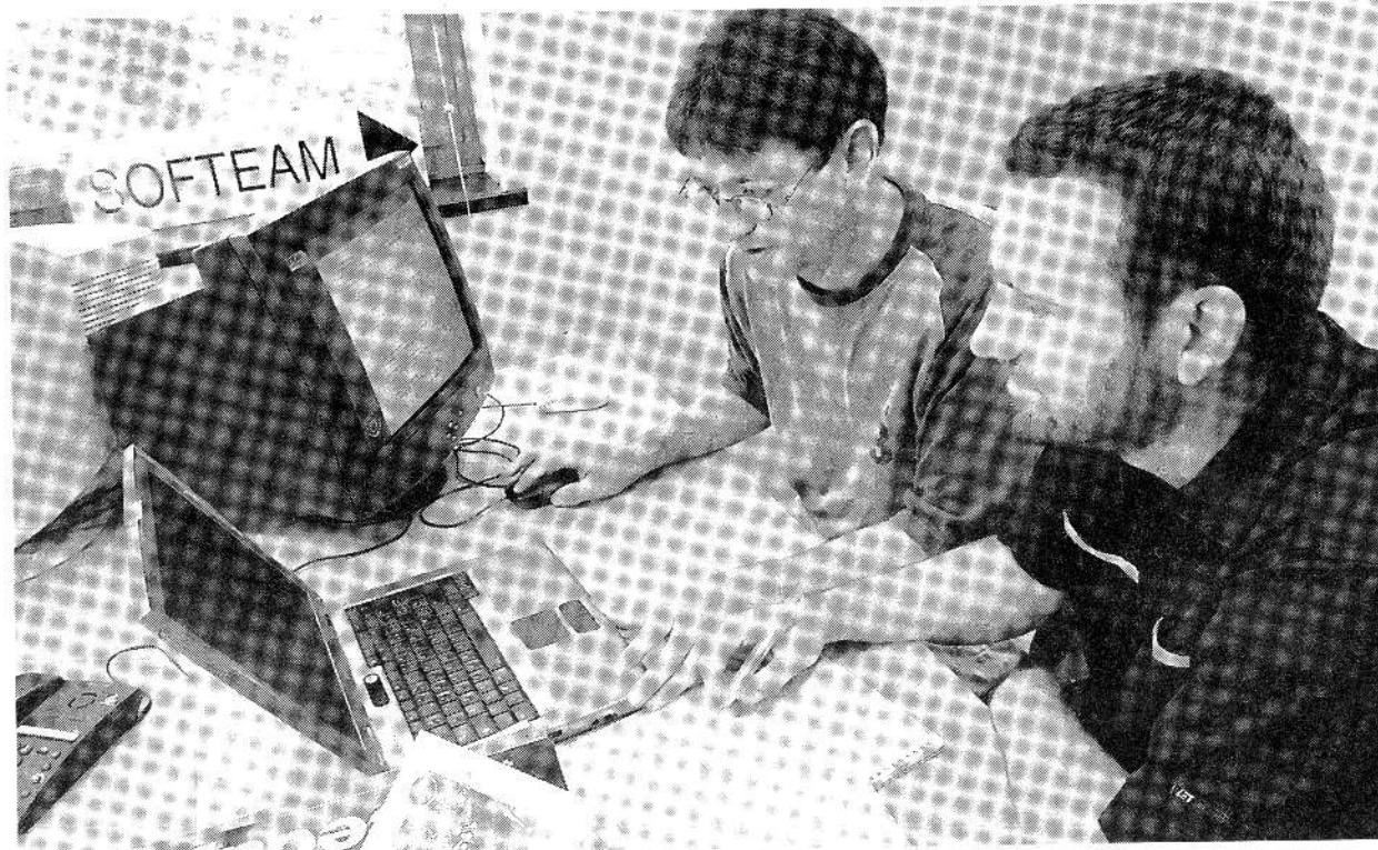
Des jeunes ingénieurs chez Softeam, à Rennes : l'informatique est le secteur qui recrute le plus de débutants.

Après trois années noires, l'informatique a retrouvé des couleurs l'an passé en recrutant 40 000 personnes. L'embellie se confirme cette année et devrait se prolonger jusqu'en 2008.